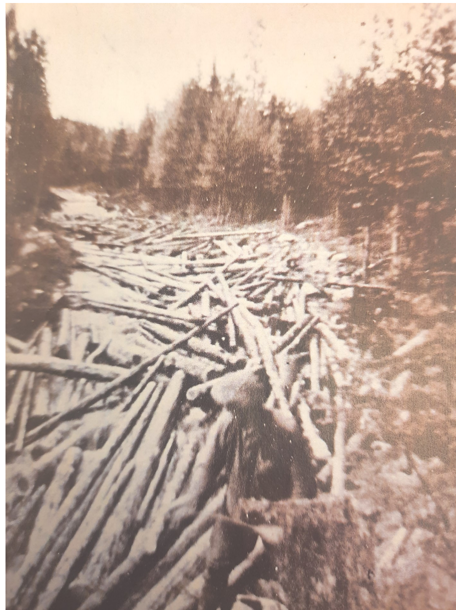
Bilden till vänster visar ett gammalt foto av Mörtälven under flottningspoken. Notera allt timmer som flottades i denna lilla älv

Leaderprojektet som initierats av Bortan-Häljebodas Fvof samt Eda fiskevårdskrets går ut på att just återställa Mörtälven till så nära som det går att det såg ut innan flottningspoken. Med hjälp av grävmaskin och armkraft har man återfört mycket av den stenen som legat i strandkanten av älven samt byggt lekbottnar och tillfört död ved till vattendraget. Åtgärderna beräknas att kunna öka populationen av Öring i älven med över 50%. Någon som i sin tur kommer generera sjövandrande öring ut till sjön Storeken.